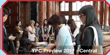
YPC Preview 2011 - Central