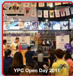
YPC Open Day 2011