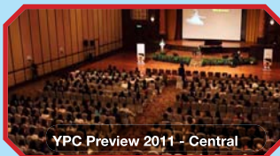
YPC Preview 2011 - Central

这项对老师的特别述评从2011年4月开始在全国各地陆续举行. 最大型的述评会在八打灵, 双威酒店举行. 感谢导师们出席这个会议, 与我们一同探讨完整的雅马哈音乐概念.