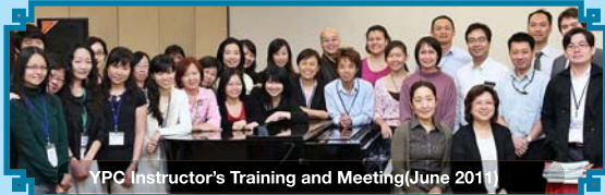
YPC Instructor's Training and Meeting (June 2011)

会议于2011年8月在YMM格拉再也成功举行, 议程也包括了导师交流对话. 雅马哈音乐教育部要趁这个机会向参与及支持这个会议的导师致谢.