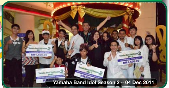
Yamaha Band Idol Season 2 ~ 04 Dec 2011