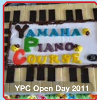
YPC Open Day 2011